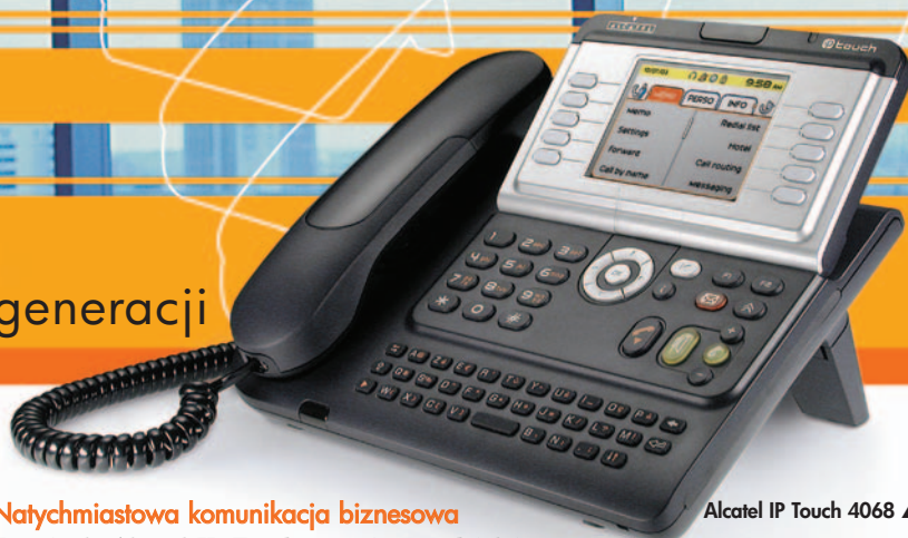
Alcatel IP Touch 4068 ▲

Nowe narzędzia komunikacyjne pojawiają się nieprzerwanie — od elektronicznych asystentów PDA po telefony komórkowe i laptopy, jednak najlepszym środkiem firmowej komunikacji z za biurka pozostaje telefon stacjonarny.