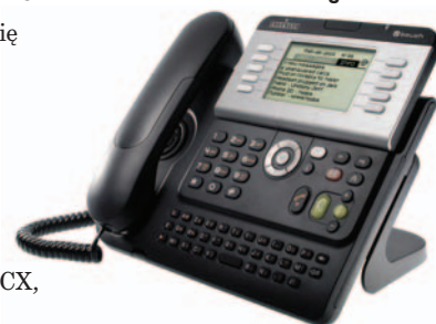
Podstawa pod kątem 60 stopni ▲